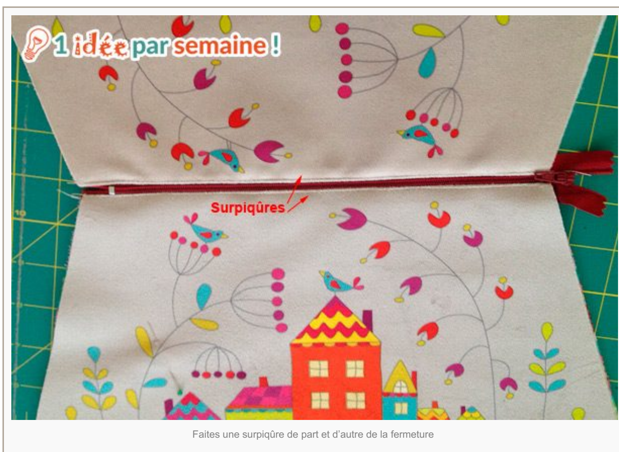
Faites une surpiqûre de part et d'autre de la fermeture

Faites la même chose pour l'autre face de la trousse. Ouvrez vos coutures et écrasez-les délicatement avec l'ongle. Faites une surpiqûre de part et d'autre de la fermeture éclair dans le sens de la longueur.