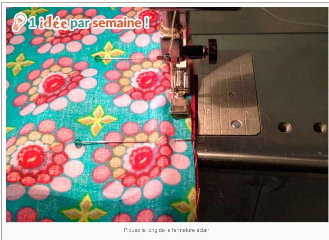
Piquez le long de la fermeture éclair

Faites la même chose pour l'autre face de la trousse. Ouvrez vos coutures et écrasez-les délicatement avec l'ongle. Faites une surpiqûre de part et d'autre de la fermeture éclair dans le sens de la longueur.