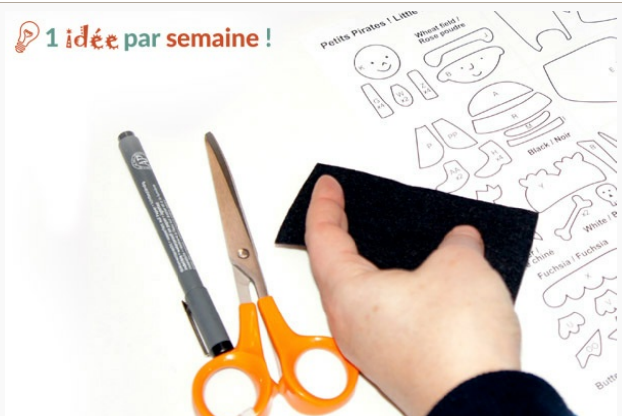
Feutrine à découper