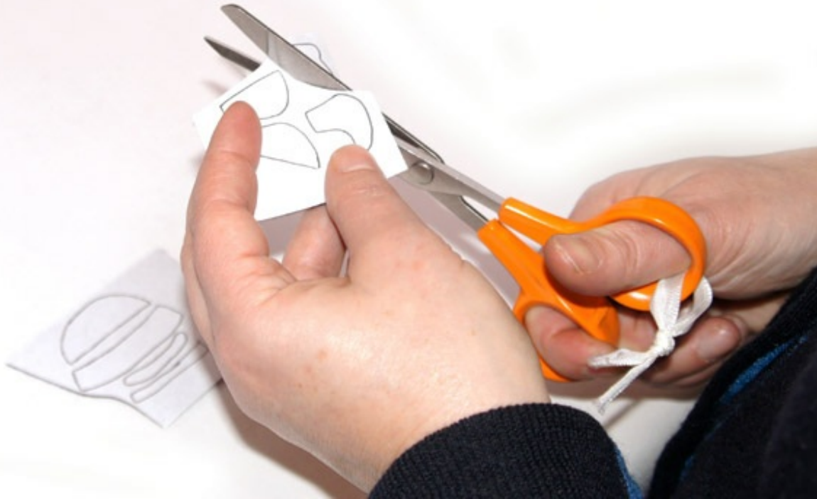
Découper en même temps le Freezer-Paper et la feutrine