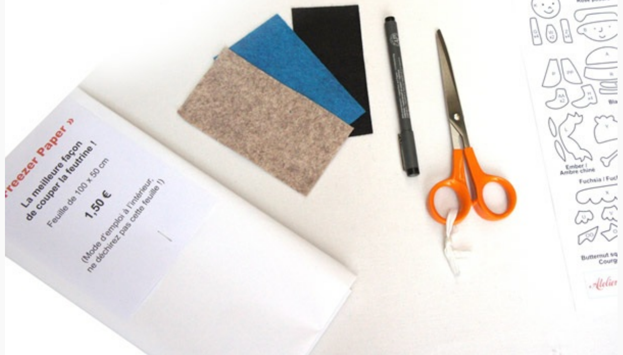
Préparation du matériel

On décalque toutes les pièces qui doivent être coupées dans une même couleur sur un morceau de Freezer Paper de la même taille que la feutrine. C'est plus pratique, ça évite les oublis : on utilise plus facilement toute la surface de feutrine disponible. Si les pièces sont tracées d'avance dans cet espace, suivez le plan. Sinon, imbriquez-les de façon à utiliser tout l'espace. Décalquer c'est très facile : on pose le papier côté ciré sur le plan, et on reporte le motif par transparence.