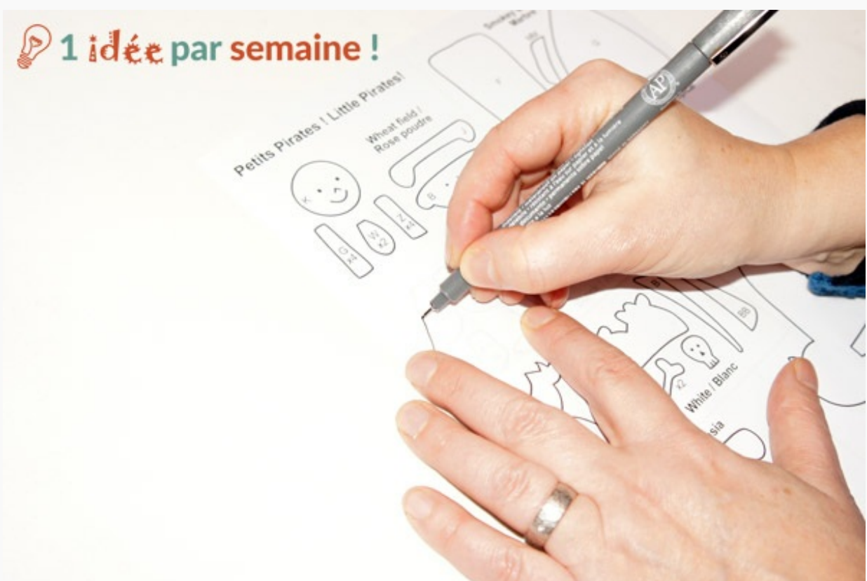
Découper les pièces