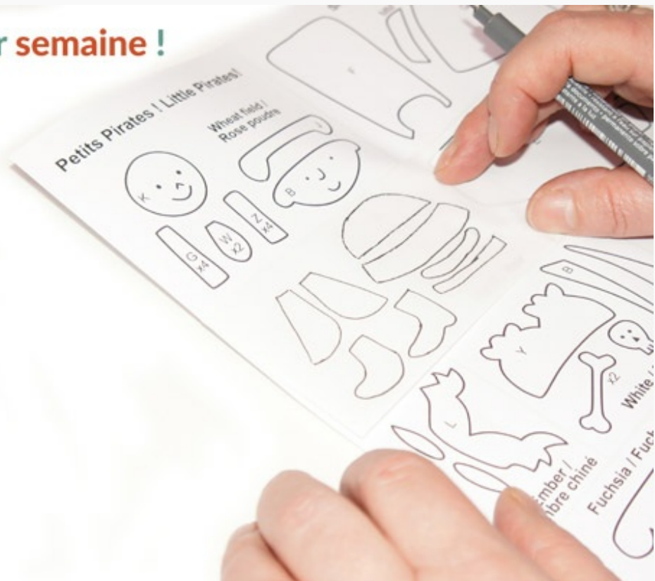
Découper les pièces – fin

On superpose ensuite le Freezer et la feutrine et on repasse à fer chaud, sans vapeur : le Freezer-Paper adhère à la feutrine.