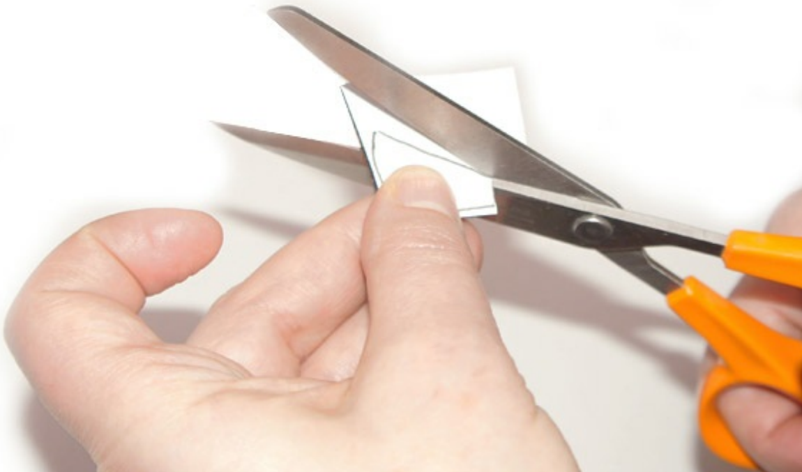
Découper en même temps le Freezer-Paper et la feutrine – suite