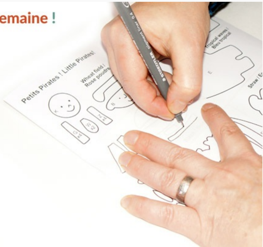
Découper les pièces – suite