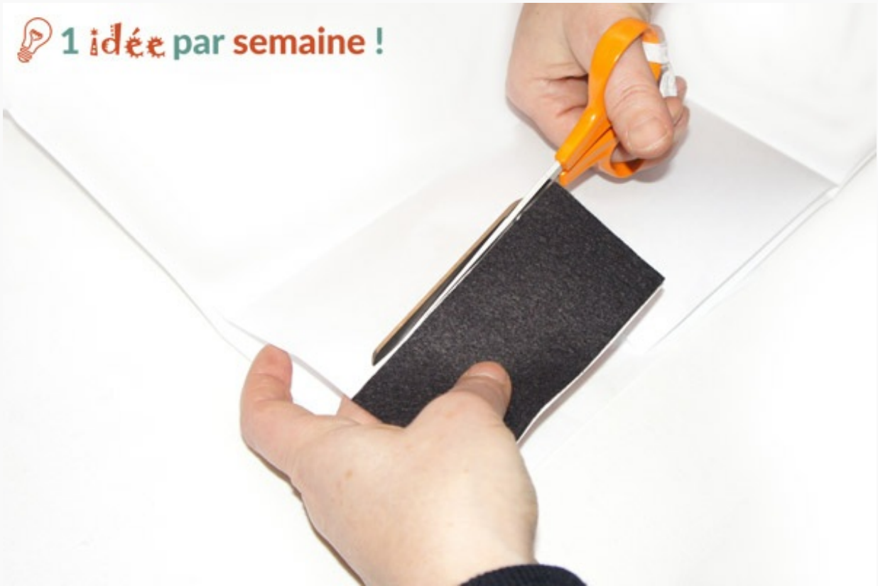
Couper le Freezer-Paper à la taille de la feutrine